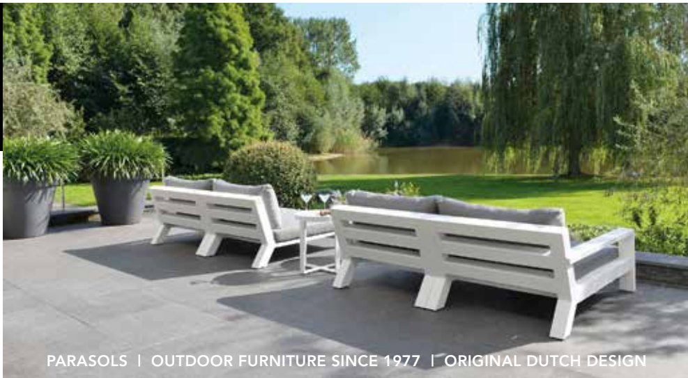
PARASOLS | OUTDOOR FURNITURE SINCE 1977 | ORIGINAL DUTCH DESIGN